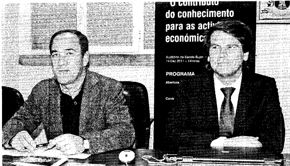
Os responsáveis pelo IPCB mostram-se satisfeitos