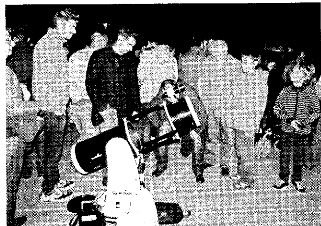
A iniciativa teve bastantes participantes

Cerca de quatro dezenas de pessoas participaram, na noite de 4 de maio, numa iniciativa organizada pela Escola Superior de Tecnologia, a Escola Secundária Amato Lusitano e o Centro Ciência Viva de Constância, com o objetivo de contribuir para uma divulgação mais ampla da astronomia na cidade de Castelo Branco.