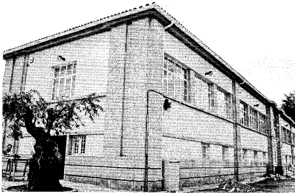
A empresa Águas do Centro está em casa nova

Com um investimento de 2,5 milhões de euros, a nova estação de tratamento ocupa uma área de 27 mil metros quadrados, em terrenos paralelos à auto-estrada, entre o nó do Hospital e a saída norte para Castelo Branco,