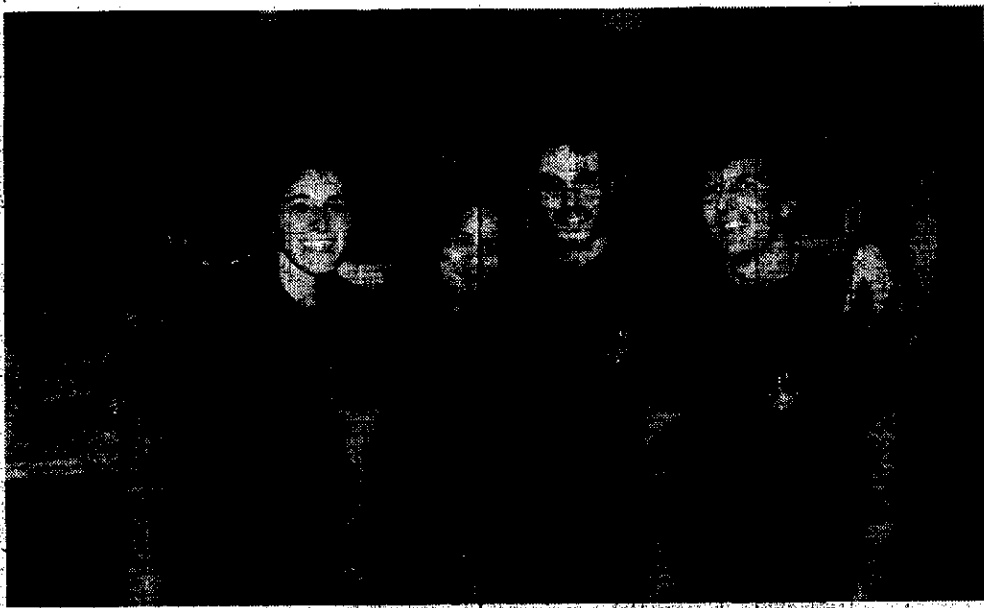
Residência de Estudantes