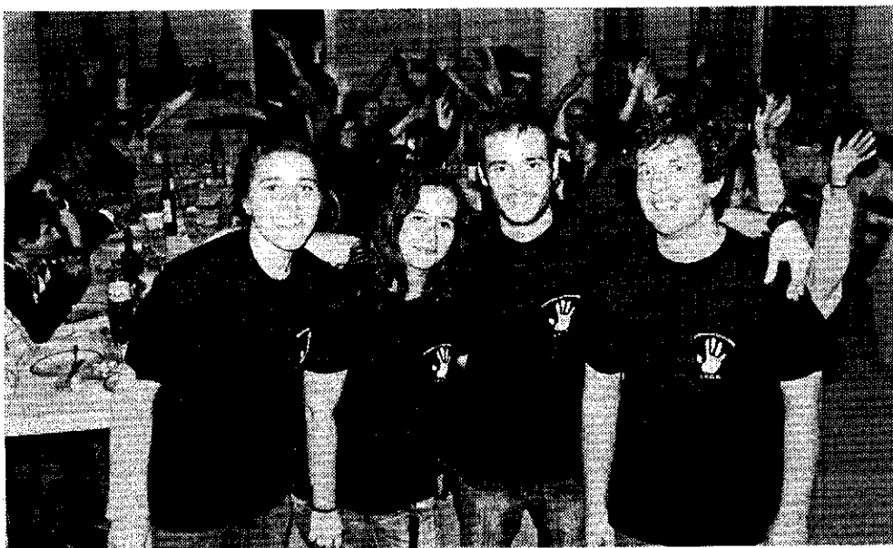
Residência de Estudantes