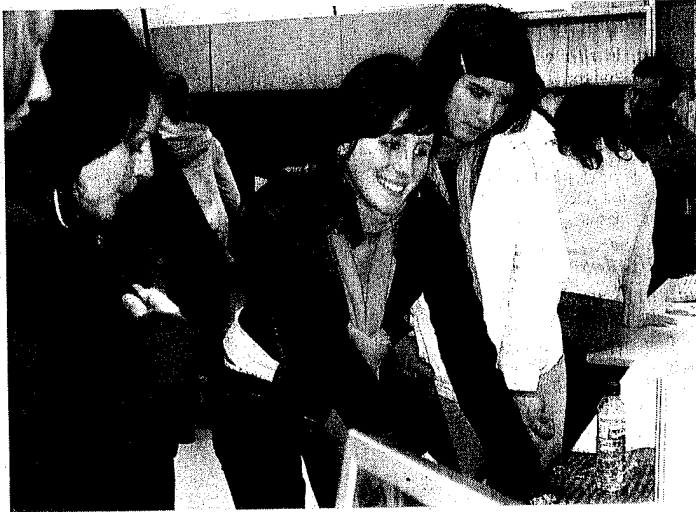
A iniciativa está a recolher o entusiasmo dos jovens

A Superior de Tecnologia de Castelo Branco quer facilitar a escolha de um curso aos alunos de 12º Ano, pelo que organizou uma semana aberta em que prevê receber 800 alunos de 20 escolas e cinco distritos diferentes. A iniciativa vai na terceira edição e cresce de ano para ano.